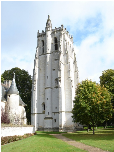
Tour Saint-Nicolas. 2013.

1450 : la Normandie redevient française. Reconstruction de l'abbaye : Restauration des installations sanitaires, réfection des canalisations amenant et distribuant l'eau, reconstruction de l'infirmerie dotée d'une chapelle, restauration de l'église et des vitraux, construction de moulins, manoirs, granges, aqueducs.