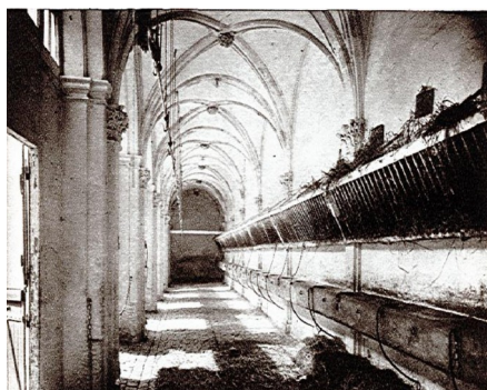
Le cloître vers 1927.

1945 : Cession de l'abbaye au ministère de l'éducation nationale, service des monuments historiques.