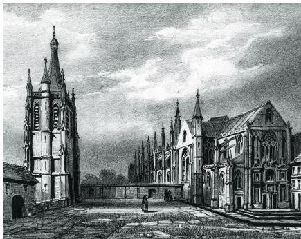
Église abbatiale et tour Saint-Nicolas. Lithographie de Nicétas Périaux. XIX ème siècle.

1419 – 1450 : Réparation de l'abbaye en ruine.