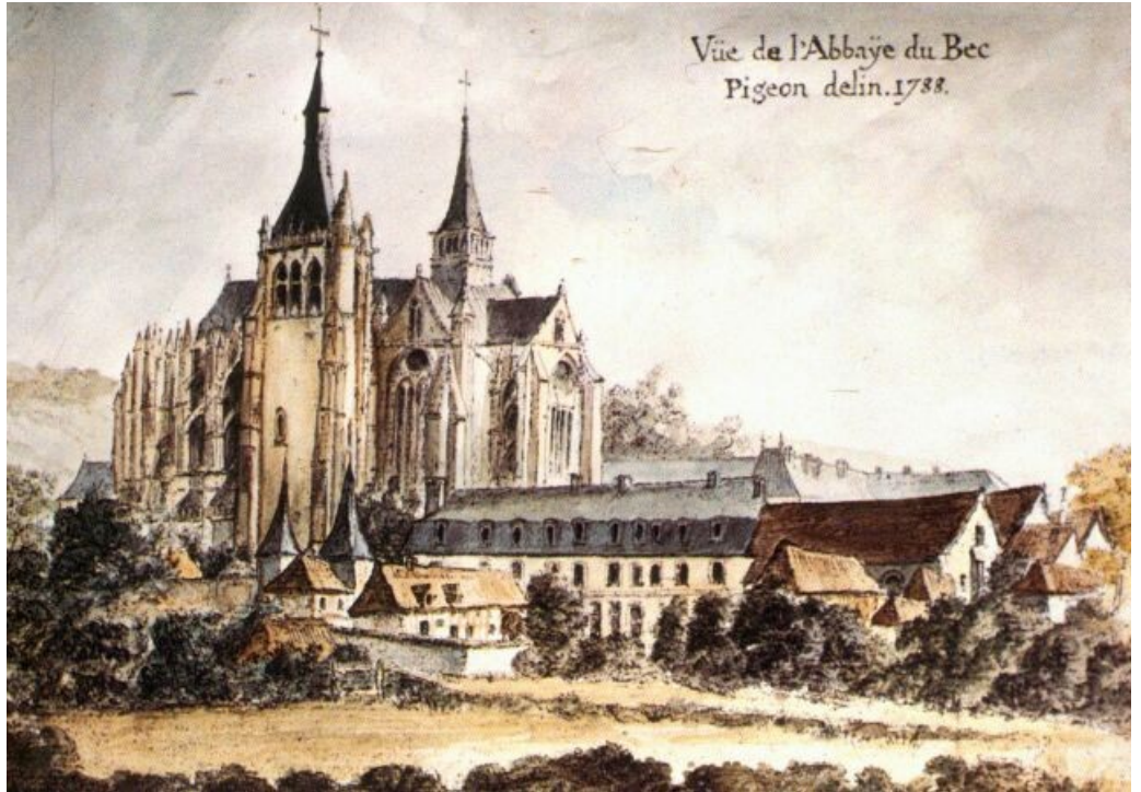
Vue de l'abbaye. 1788.

1490 : Construction de la grande porte de l'abbaye.