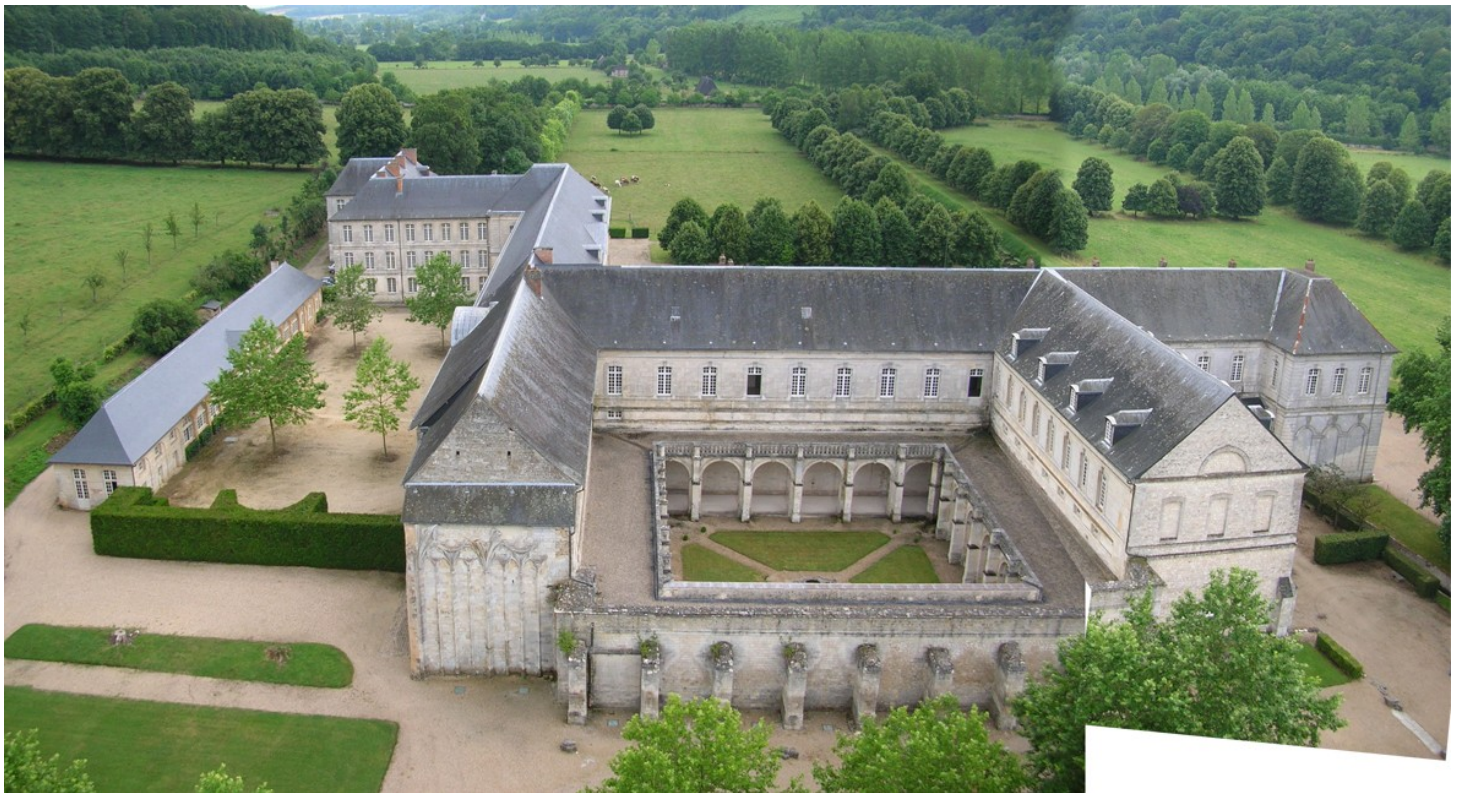
Vue de l'abbaye depuis la tour Saint-Nicolas. 2010.

1979 – 1984 : Aménagement de l'ancien cellier en bibliothèque.