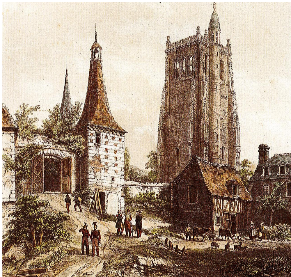
Lithographie de la place de l'abbaye vers 1830.

1742 – 1747 : Construction du nouveau réfectoire, long de 75 mètres, et du dortoir, long de 66 mètres.